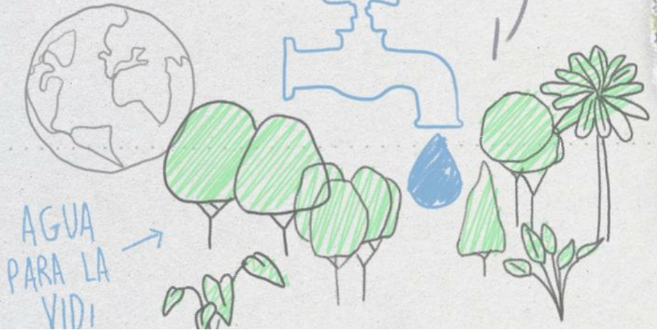
AGUA PARA LA VIDA